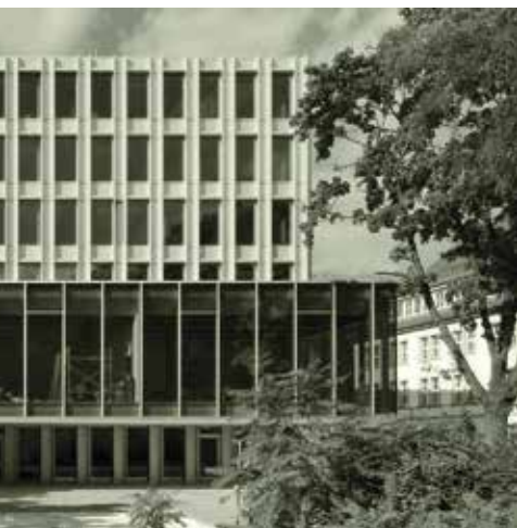
Centro de conferencias

Con sus 27 representaciones en el exterior contribuye a la creación y el fortalecimiento de redes entre organizaciones de la sociedad civil y los Estados, personas y proyectos comprometidos con la ecología, los derechos humanos, la igualdad de oportunidades y la democracia. Sus expertos son interlocutores reconocidos en todo el mundo.