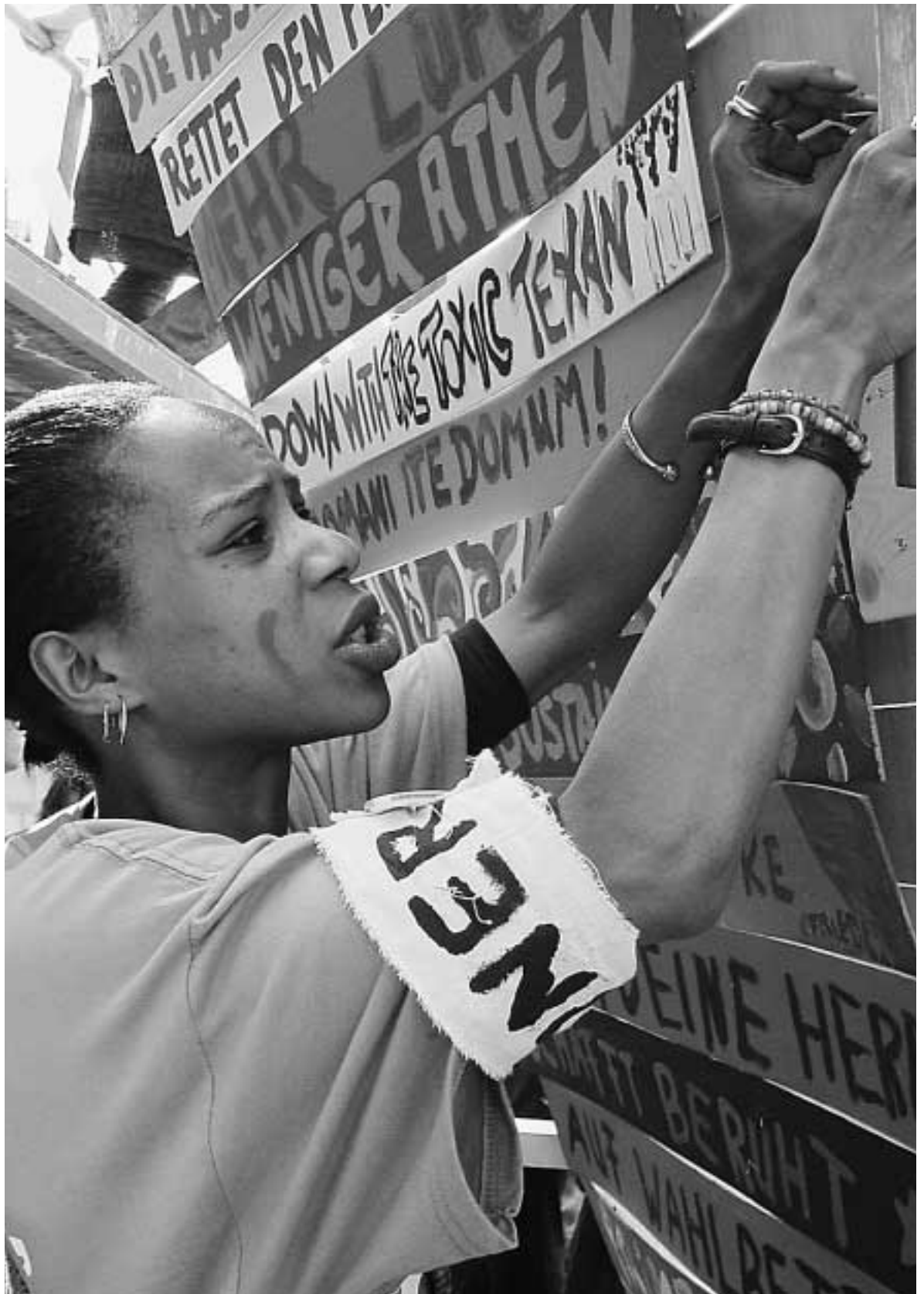
El bote salvavidas: Acción de Amigos de la Tierra Internacional para la Conferencia sobre el clima (Bonn 2001)