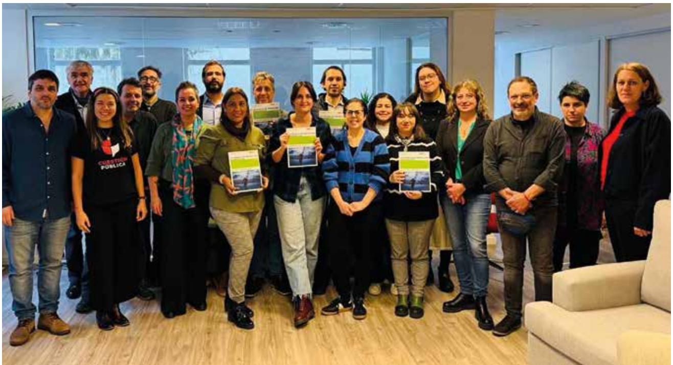
Pie de foto: Periodistas y colectivos profesionales de Argentina, Brasil, Chile, Colombia, Guatemala, Paraguay, Perú y Uruguay junto a representantes de Reporteros Sin Fronteras (RSF), del Comité Para la Protección de Periodistas (CPJ) y de la Fundación Heinrich Böll de las oficinas de Santiago y Buenos Aires.

En consecuencia, esta iniciativa se inscribe en el marco de decisiones y esfuerzos internacionales en favor de la democracia, la libertad de expresión y la seguridad de periodistas.